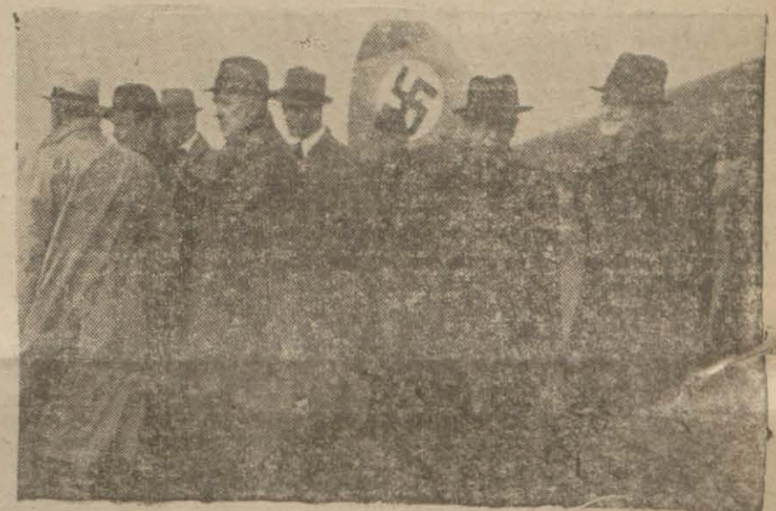
Alman matbuat heyeti Yeşilköy tayyare istasyonunda kendilerini karşılayanlar arasında

Heyete Alman Hariciye Nezareti Matbuat Dairesi Başkanı riyaset etmektedir