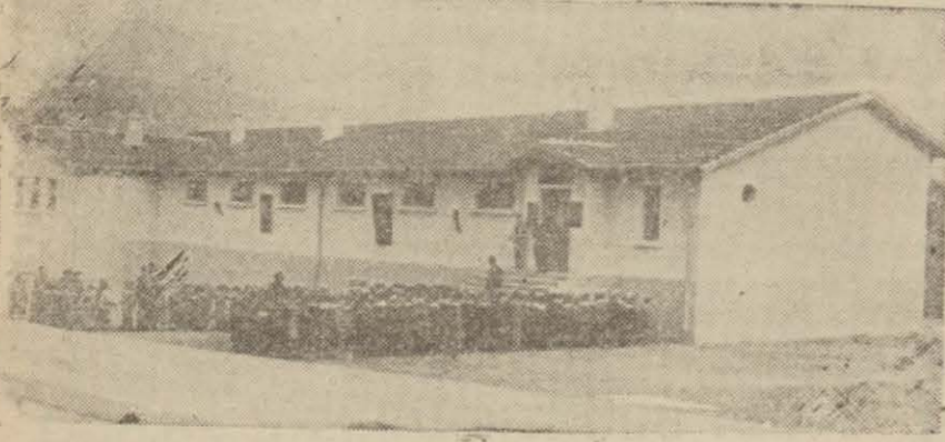
Yeni yapılan İsmetpaşa ilköğretim okulu

Tokad, (Hususi) — Zلزله felaketi geçirmiş olmasına rağmen vilâyetimizde geçen yıllara nisbeten çalışmaları bu sene daha kuvvetlendirilerek şâ-yanı memnuniyet bir hale sokulmuş-tur. Bilhassa esaslı çalışmalarla kısa bir zamandanberi muntakamızda bariz hususiyetler belirten valimiz İzzettin Çağpar birçok şahsî teşebbüsleri ile vilâyetimizi kültür, sağlık, sıhhat, sınaî ve ticarî; zirai sahalarda ve köy kal-kınmaları işlerinde eskisinden oldukça farklı denilebilecek kadar terakki-ye kavuşturmuştur. Bu cümleden ola-rak Tokadın bir kazası bulunan Erba-anın ötedenberi mevcut ve fakat bir türlü yapılamadığından halkın Sam-