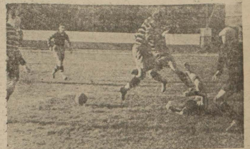
Fenerbahçe - Beykoz maçından heyecanlı bir sahne

Galatasaray uzun çirpimlardan sonra Beyoğlusporu ancak 1 - 0 yenebildi