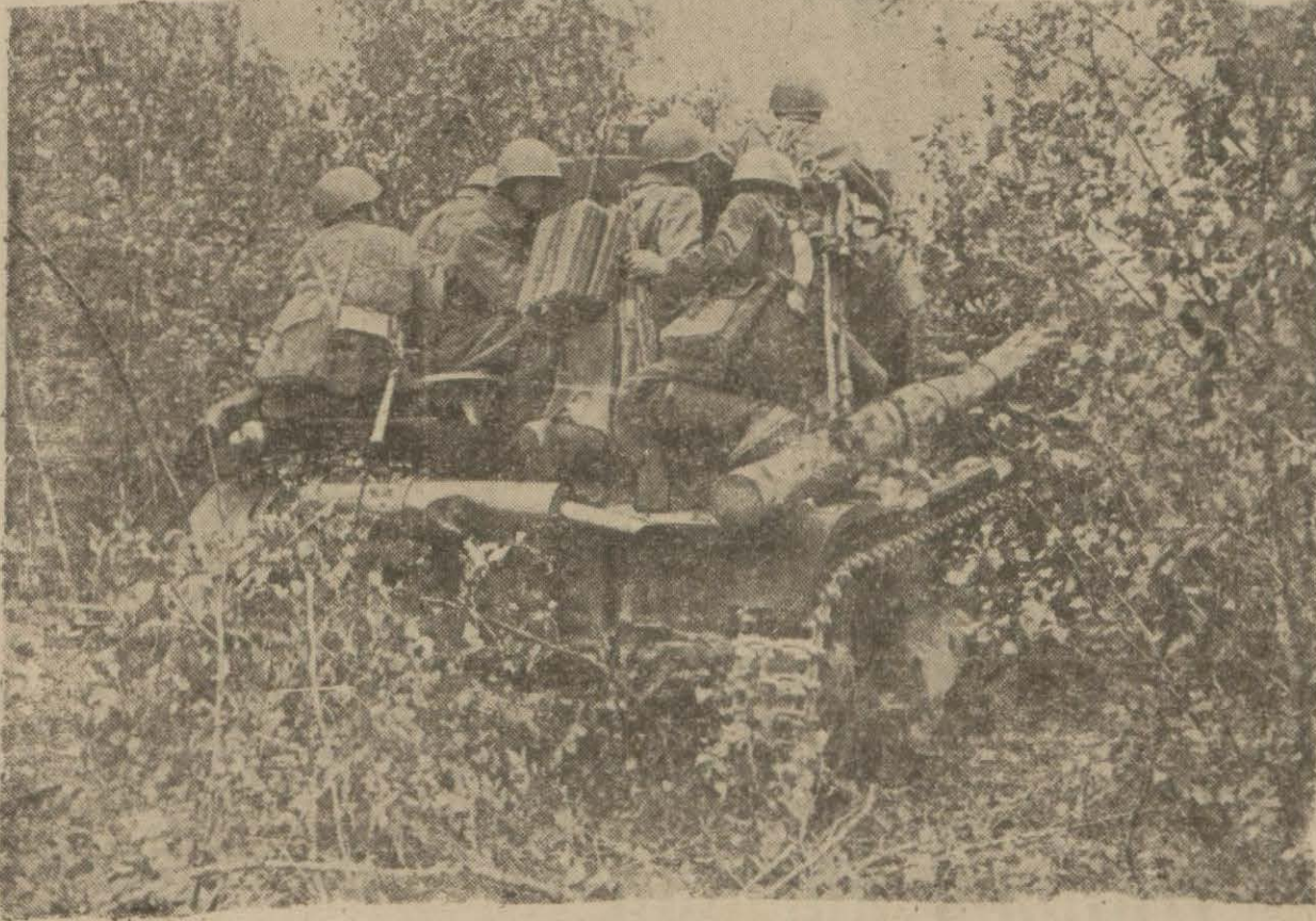
Sovyet tankçıları ueri mevzi girerken

Vişi bildiriyor: Alman ordusu "Kerç,"e girdi!