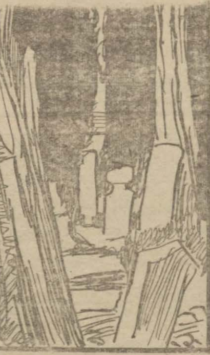
«Ölüm karşısında insanın vazifesini bir gün geleceği için meskenete dal, mak değil, fakat ölümün geleceği dakikaya kadar mümkün olan hayat şe, killerinden en iyisini yaşamaktır.»